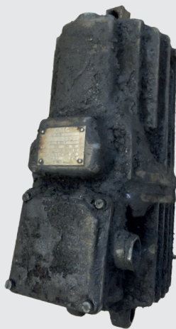
ELDROclassic® VOR der Instandsetzung

Nutzen sie das know-how des Herstellers!